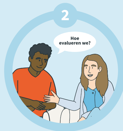
Afspraken maken over evalueren